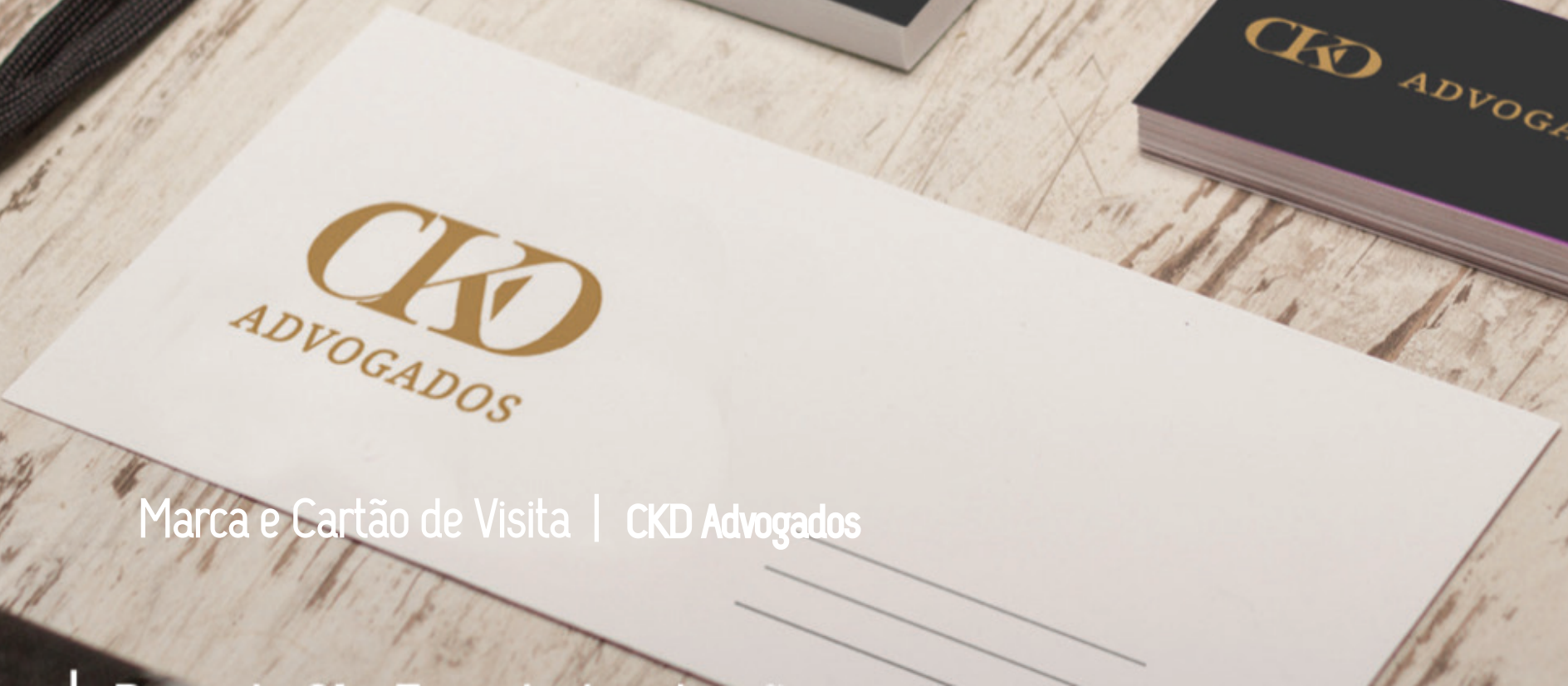
Marca e Cartão de Visita | CKD Advogados