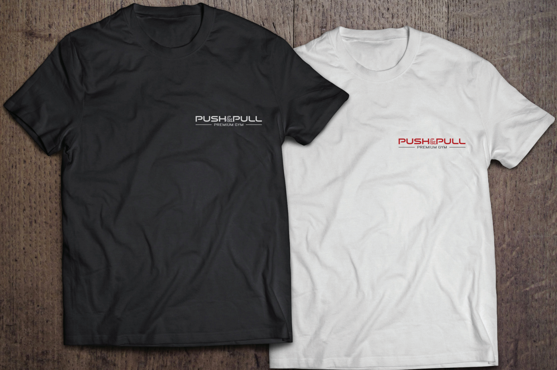
Camisetas | Push&Pull Premium Gym